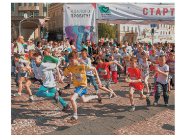
На старті – «Команда здійсненої мрії» та інші діти-учасники.