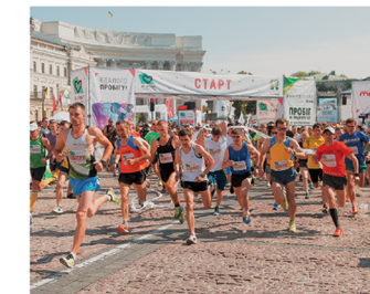
10:00 – забіг для спортсменів.