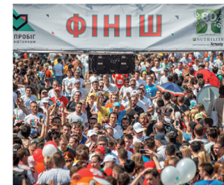
В травні в Києві відбувся традиційний благодійний «Пробіг під каштанами». Цього року він пройшов 24-й раз.

«Пробіг під каштанами» є не тільки однією з перших благодійних акцій в Україні, а й найпершою акцією, що об'єднала благодійність і спорт. Якою б не була мотивація учасників, результат один – сотні дітей, життя яких вдалося врятувати завдяки обладнанню, закупленому на гроші, зібрані в рамках Пробігу.