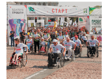
Старт учасників на візках – «Забіг Мужніх».