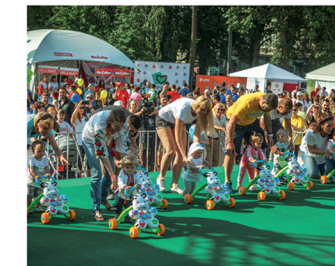
Програму заходу відкрив 4-й «Пробіг в ходунках» для дітей від 6 до 14 місяців.