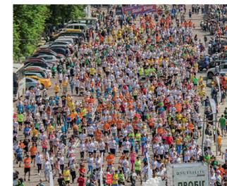
Наймасовіший старт. Загалом до проекту в 2016 році долучилося 10 188 учасників, в тому числі в складі 199 корпоративних команд.