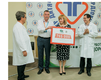
Завдяки учасникам «Пробігу під каштанами 2016» Центру дитячої кардіології та кардіохірургії МОЗ України було передано 765 000 гривень.

ДЯКУЄМО ЗА УЧАСТЬ. ДО ЗУСТРІЧІ НА СТАРТІ 25-ого ЮВІЛЕЙНОГО «ПРОБІГУ ПІД КАШТАНАМИ»!